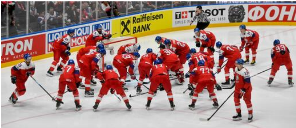
obrázek č. 2- Český národní hokejový tým [foto] [cit. 1.2.2023]

To je ode mě protentokrát vše, děkuji a zase příště. Sportu zdar.