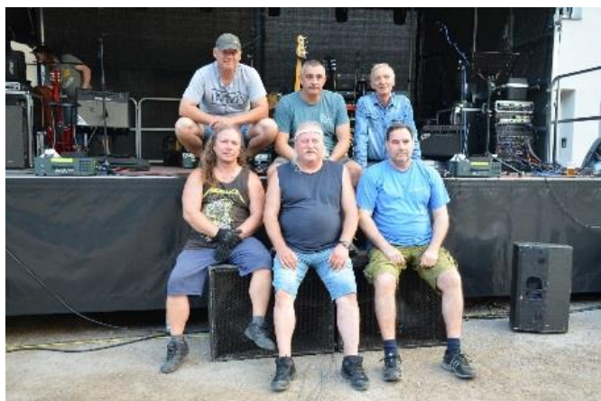
obrázek č.1 -Skupina Ikaros [foto] [cit. 19.1. 2023]